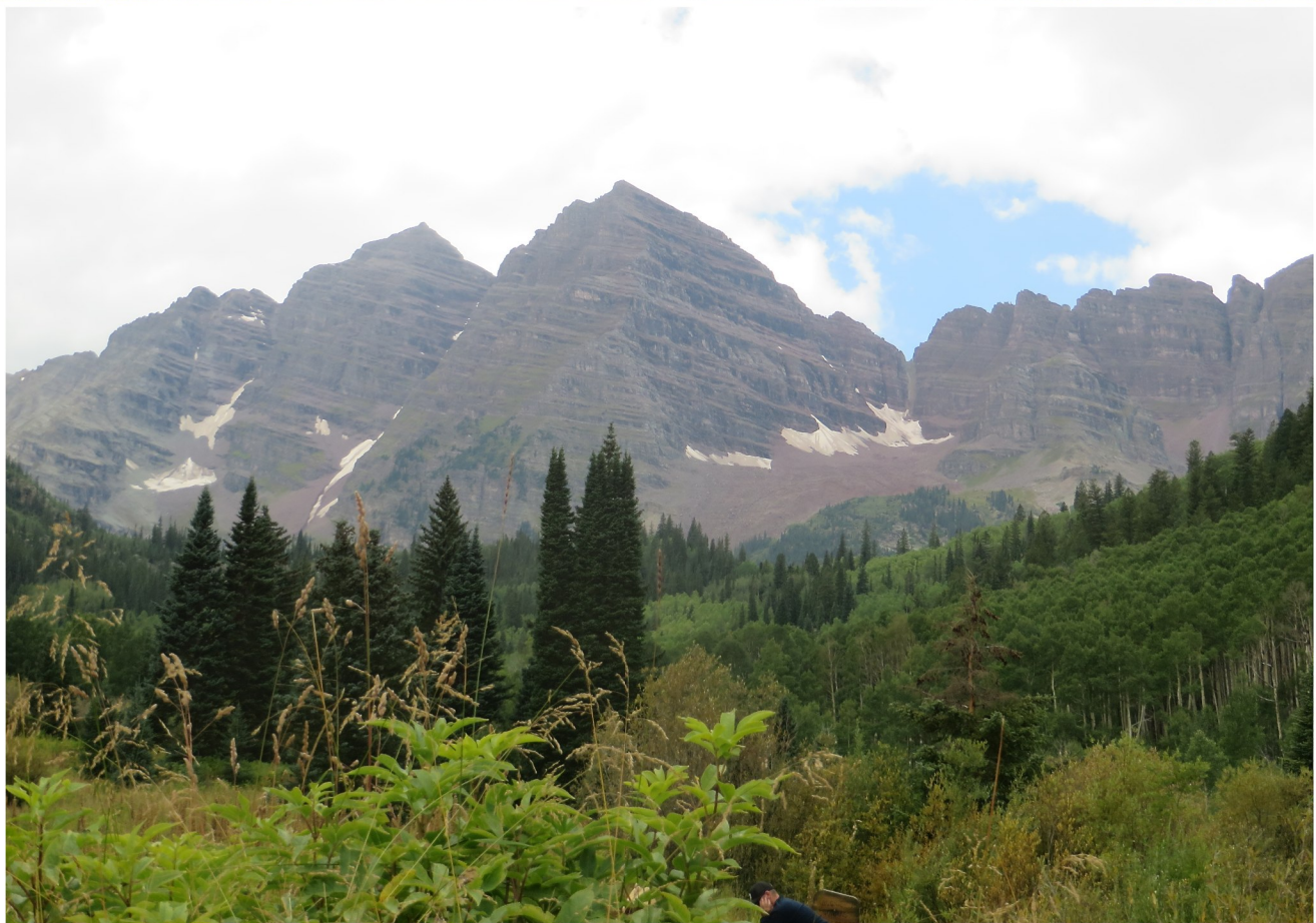
Vandring vid Maroon Lake utanför Aspen