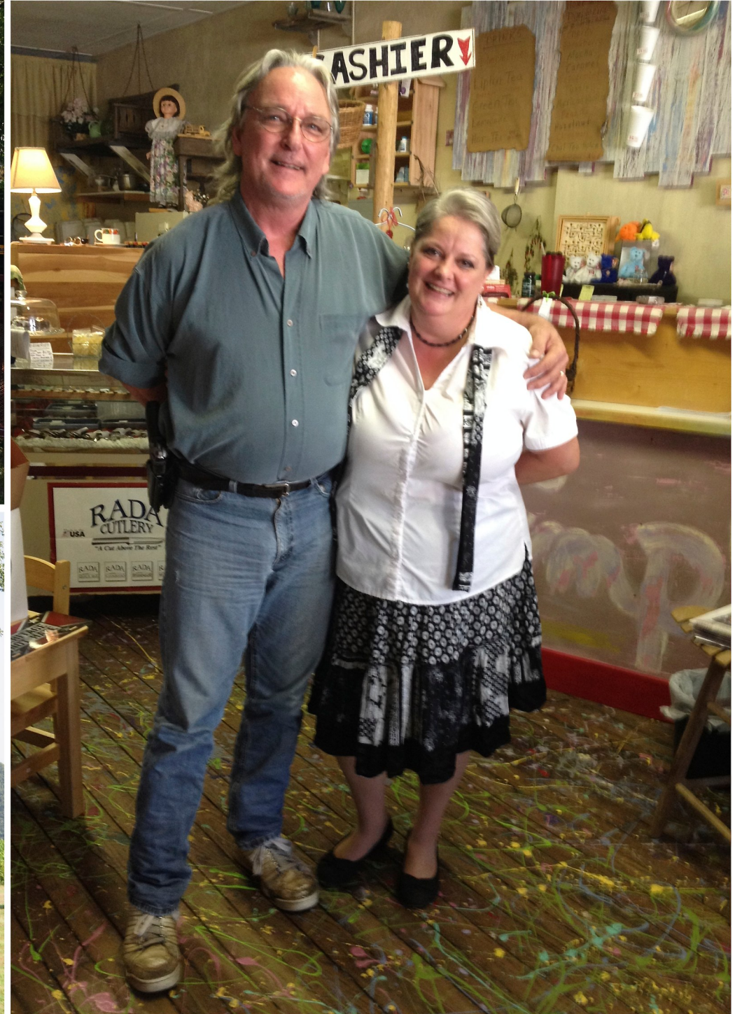
Resa genom Tennessee mellan Memphis och Nashville. Besök på vingården Century Farm utanför Jackson med tunnor som används vid skörden samt ett gammalt hus där slaverna bodde. Vi fikade på ett konstnärscafé (ägaren beväpnad).