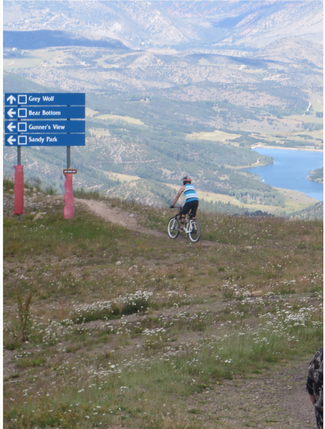
På sommaren är det Down Hill med Mounting Bike som gäller. Tar c:a 15 min ner.