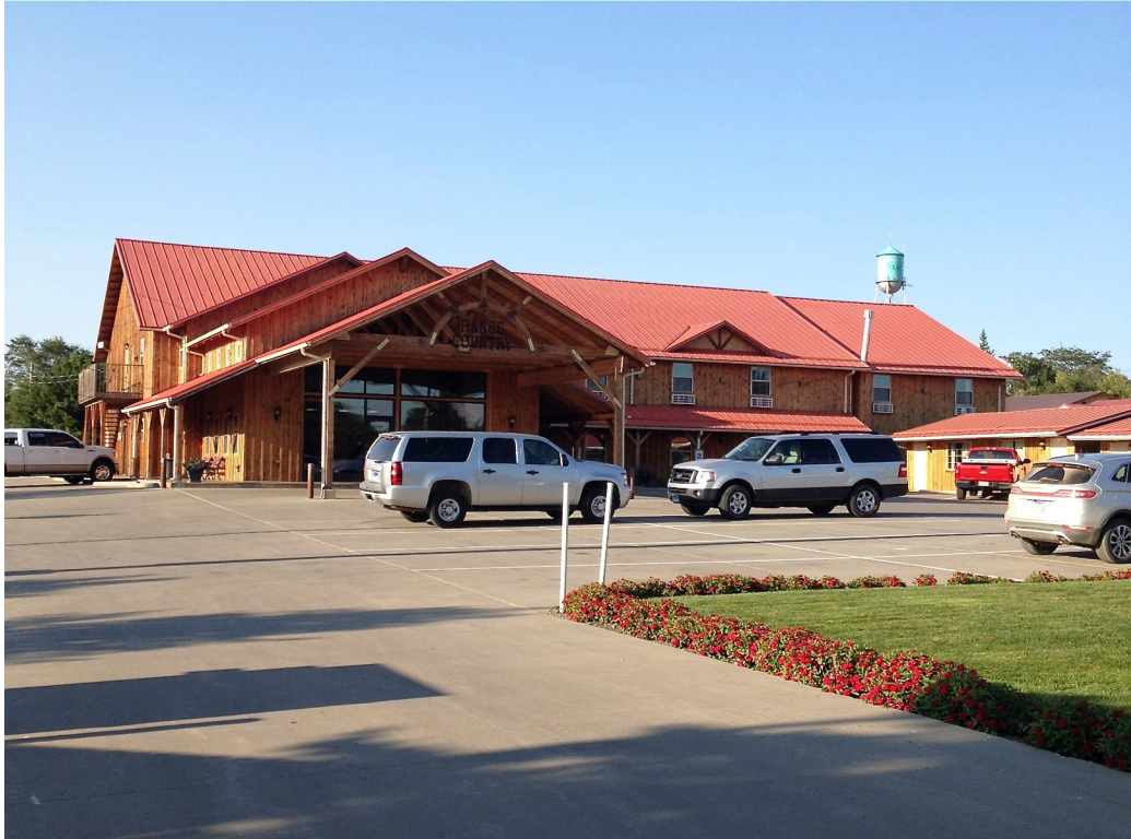
Bodde i Murdo mitt i South Dakota