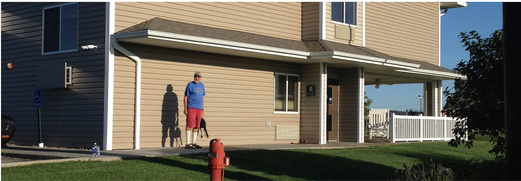
Övernattning i Missouri Valley (Iowa) strax norr om Omaha i Nebraska. Coolt matställe intill motellet