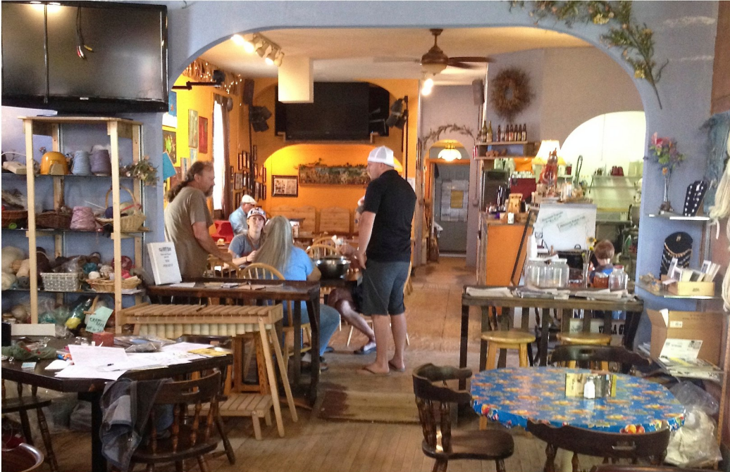
Konstnärscafé längs vägen