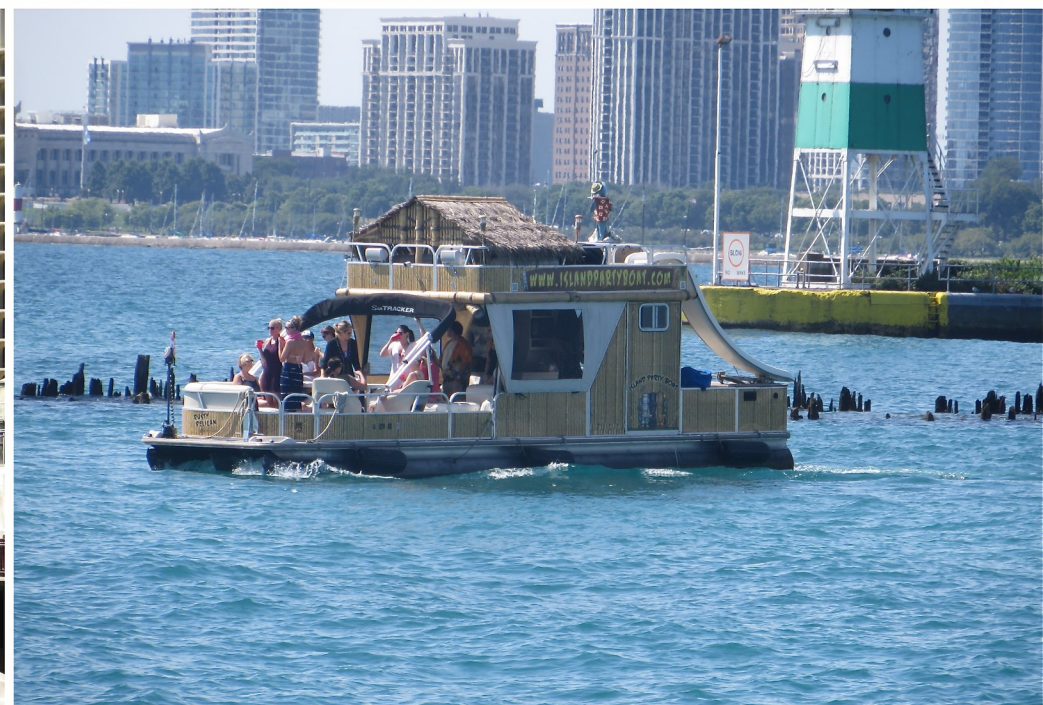
Bilder från Navy Pier och en bild från centrum. Mannen i blå kostym väntar på att äntra en båt för en kryssning på Lake Michigan med Gospelmusik (Inte båten på bilden nertill).