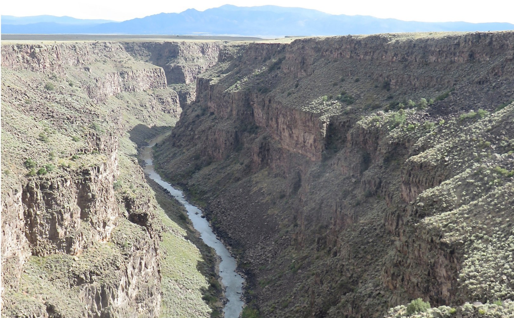
Rio Grande floden utanför Taos