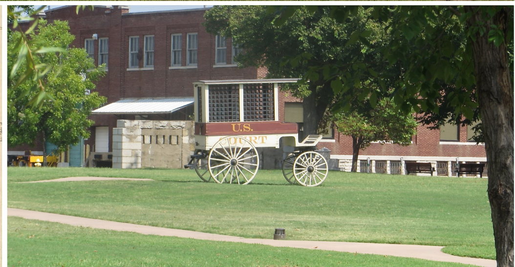
Fort Smith ligger längst väster ut i Arkansas och utgjorde under 1800-talet utpost mot indianterritorierna, Vilda västern, som var laglöst land och dit "bovar" rymde från rättvisan i dåtidens USA.