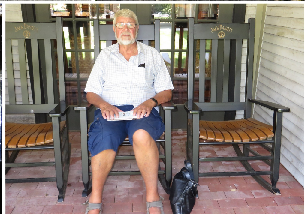
Besök på Jack Daniels Whiskeydestilleri som ligger i staden Lynchburg -Tennessee, som i sig är ett utflyktsmål