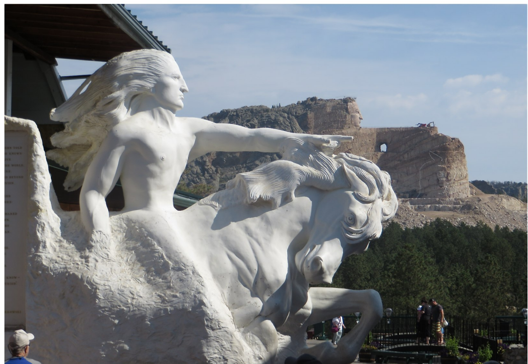
Vi bodde i staden Keystone, nedanför Mount Rushmore. Strax söder om Mount Rushmore finns ytterligare en imponerande stensulptur under uppbyggnad sedan många år, nämligen Crazy Horse Memorial. Ena bilden visar hur det är tänkt att bli.