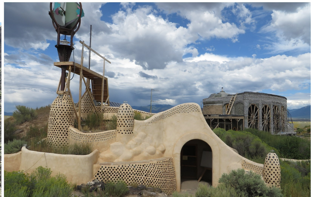
Utopisk by utanför Taos

På väg från Snowmass ner till Taos i New Mexico