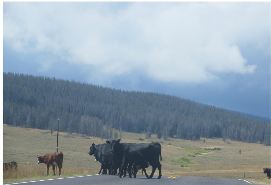
På väg från Keystone till Snowmass (grannby till Aspen), med en sväng upp i klippiga bergen norr om I40 (mellan Denver och Utah), efter övernattnig i Fort Collins ute på slätterna öster om klippiga bergen.