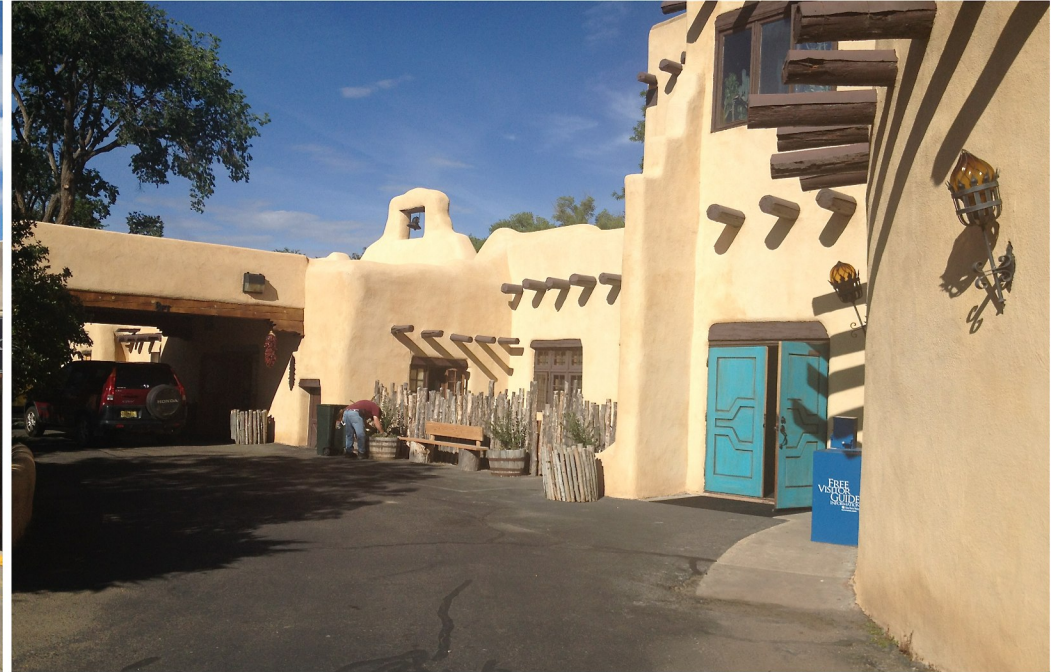
Husen i Taos byggs ofta med speciella lerstenar - Adobe med rundade hörn