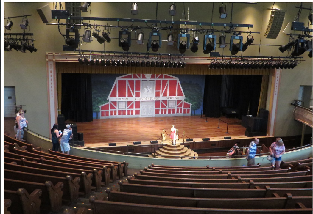
Två nätter i Nashville med stadsrundtur och promenad längs huvudgatan Broadway, med besök på Ryman Auditorium, varifrån den berömda radioshowen Grand Ole Opry sändes, och Country Hall of Fame. Det blev mexikansk mat här.