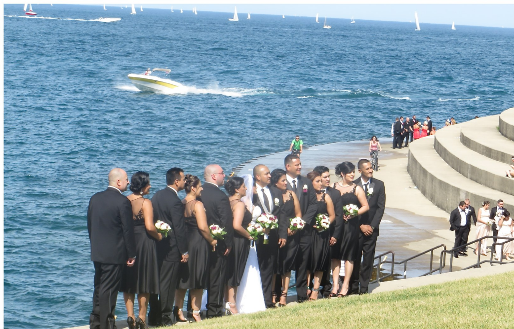
Mycket populärt med bröllopsbilder vid planetariet, som ligger på en halvö ut i Lake Michigan

Chicago. Vi bodde i Lombard - en förort till Chicago. Vi hann med en stadsrundtur.