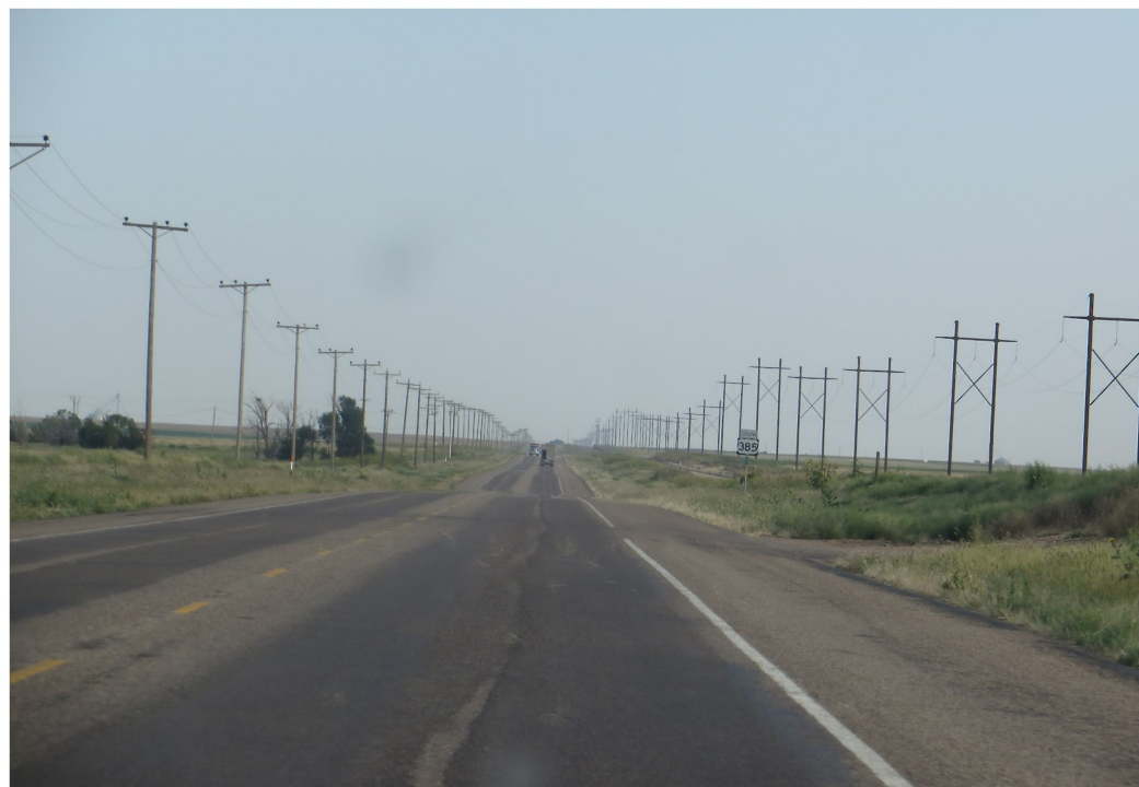
På väg mot Amarillo i norra Texas