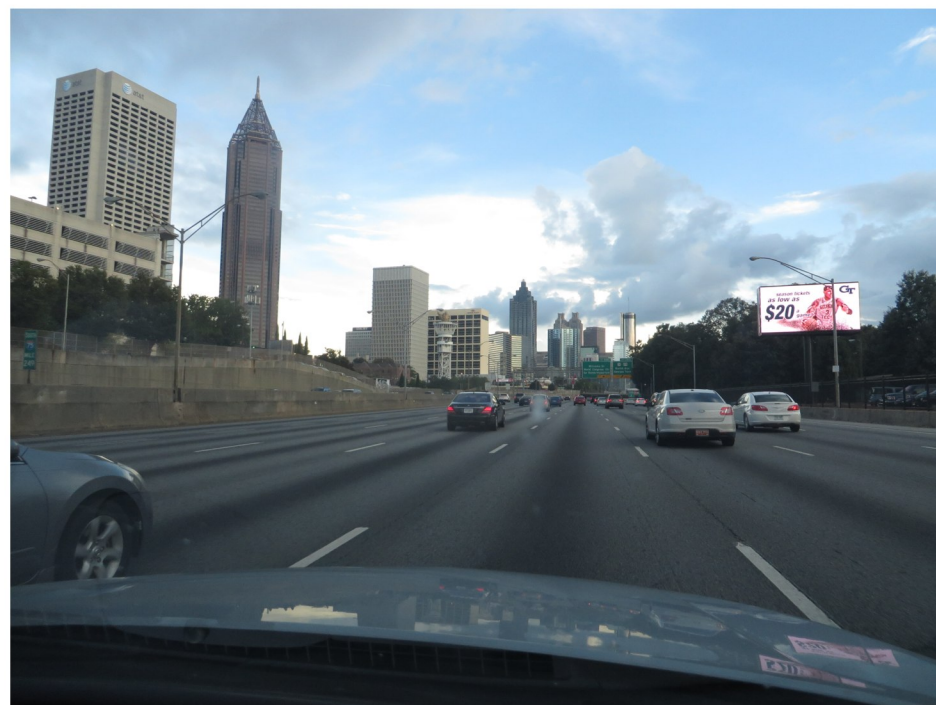
Bilresan avslutades i Atlanta -Georgia, varifrån vi flög hem