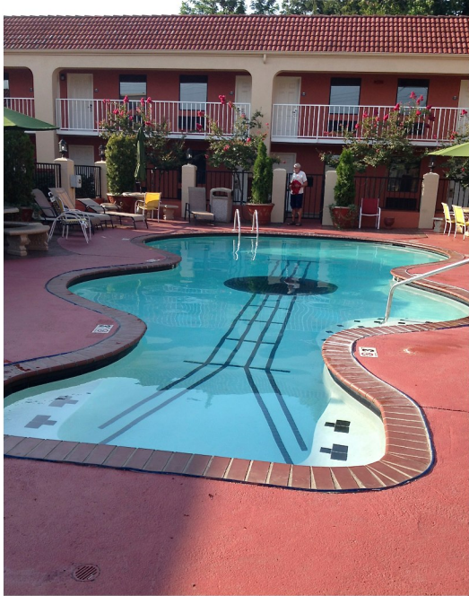
Poolen vid Days Inn - Graceland