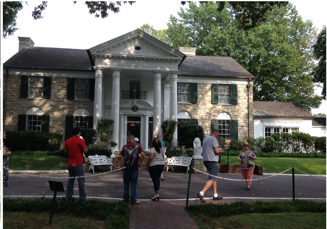
Elvis Graceland - Memphis