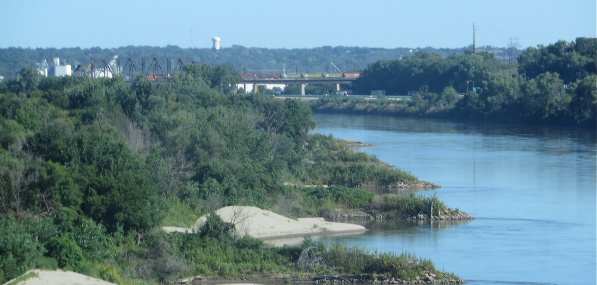
På väg västerut genom Nebraska till South Dakota. Vi korsade Missourifloden. På turistinformationen när vi kom in i Nebraska frågade de oss varför vi ville besöka Nebraska när vi åkt så långt för att uppleva USA! Var ett vackert böljande landskap