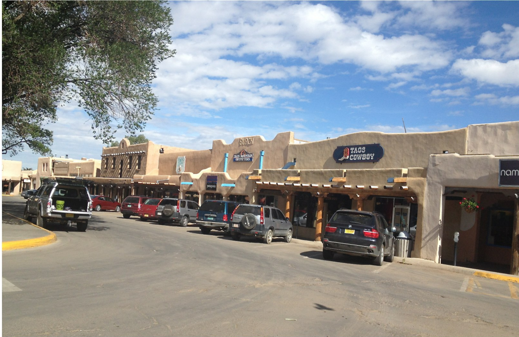
Taos central Plaza