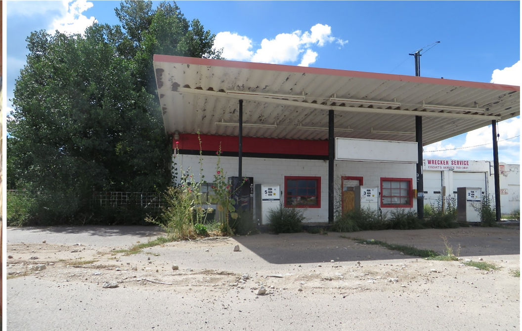
Bagdad café 2.0