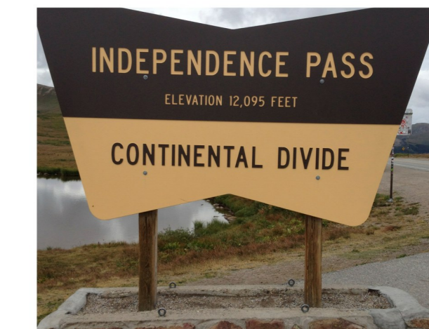
Högsta punkten på resan: 3600 möh (vandring på max. 3400 möh)