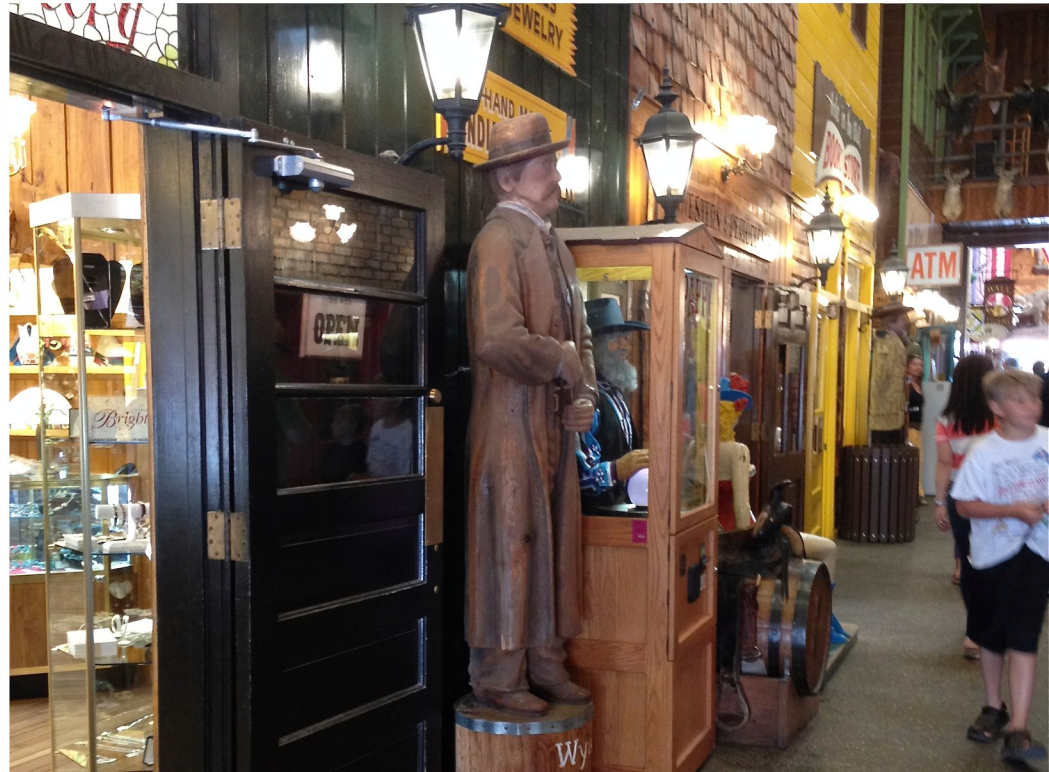
Wall: Konstig Cowboy-stad, där vi stannade för att köpa hostmedicin