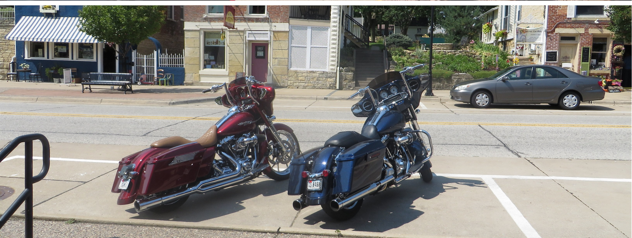
Fikapaus vid Missippifloden , vid Davenport - Iowa, där det finns ett Buffalo Bill museum