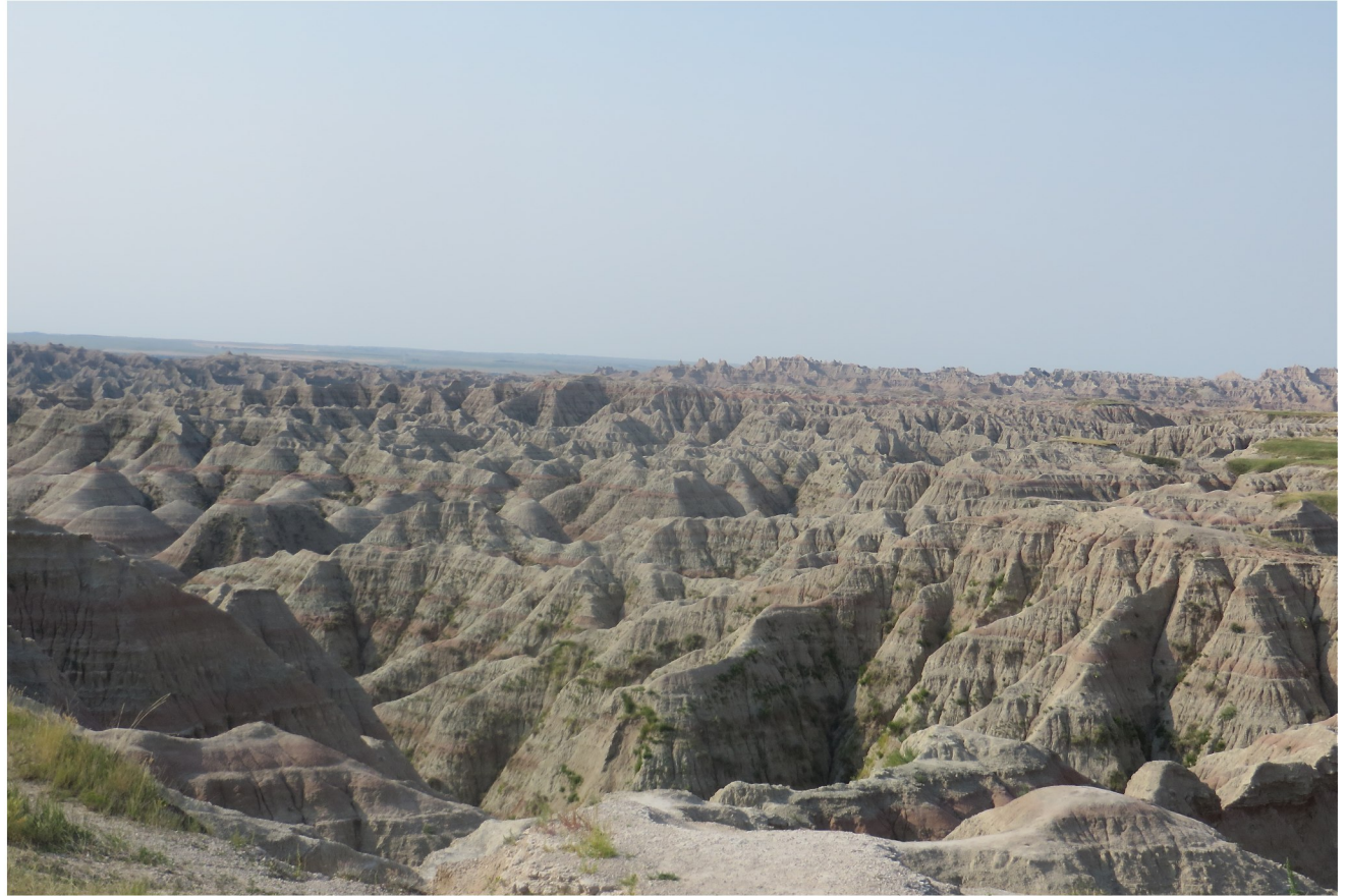
Passerade Badlands nationalpark på vägen till Mount Rushmore